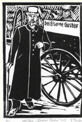
VFD-Preis „Eiserner Gustav“ Linolschnitt von Flavia Panitz

In diesem Geiste verleihen die VFD e.V. und das Fachmagazin „Der Kutschbock“ ihren Preis an Pferdefreunde, die erlebnisreiche Wanderritte oder Wanderfahrten unternommen haben und in anregender Weise darüber berichten.